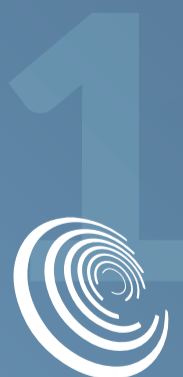
IMAGEN DE EMPRESA innovadora, reconocida por la administración